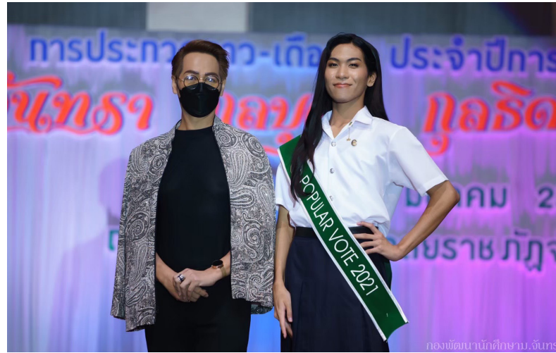
กองพัฒนานักศึกษา, จันทรเกษม

มหาวิทยาลัยราชภัฏจันทรเกษมมีกระบวนการคัดเลือกนักศึกษาที่สนใจเข้าศึกษาโดยคำนึงถึงความหลากหลายทางเพศ เปิดโอกาสให้นักศึกษาที่เป็นกลุ่มบุคคลที่มีความหลากหลายทางเพศสามารถเข้าศึกษาในหลักสูตรที่ตนเองสนใจได้